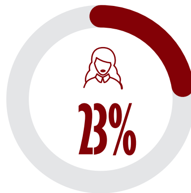
Odsetek kobiet na stadionie