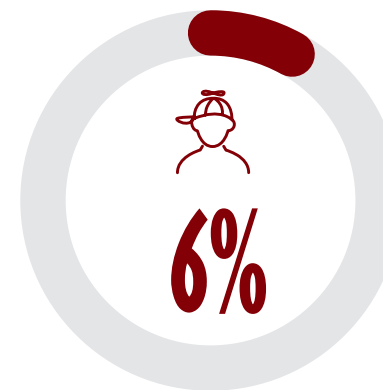
Odsetek dzieci do 13 roku życia na stadionie